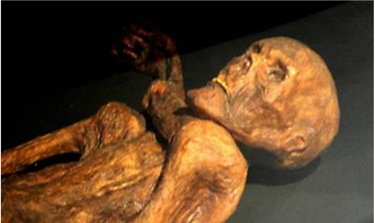
De gletschermummie 'Ötzi' die 5300 jaar geleden de dood vond in de Alpen

Blijkbaar zijn van de mannen meer bloedlijnen uitgestorven dan van de vrouwen, want die oudste man met nu nog levende mannelijke nakomen leefde 60.000 – 140.000 jaar geleden, terwijl de oudste vrouw met nu nog levende vrouwelijke nakomelingen 175.000 – 200.000 jaar geleden leefde. Dit verschil is verklaarbaar met de oorlogvoering waarbij de ene stam de andere overwon door de mannen te doden en de vrouwen te verkrachten. Vrouwen in een bepaald gebied kunnen dus oudere wortels hebben dan mannen.