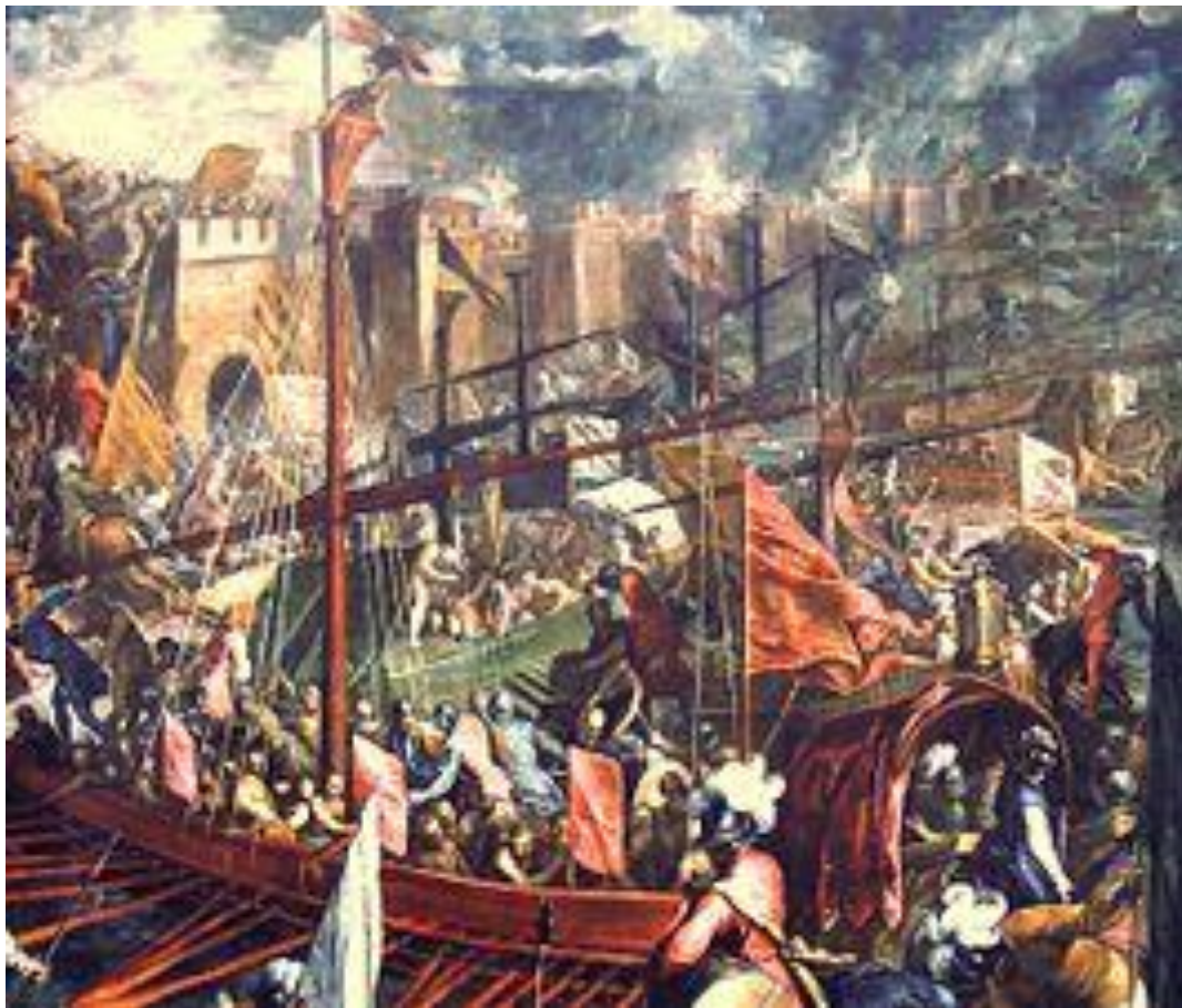
Afbeelding van de val van Constantinopel